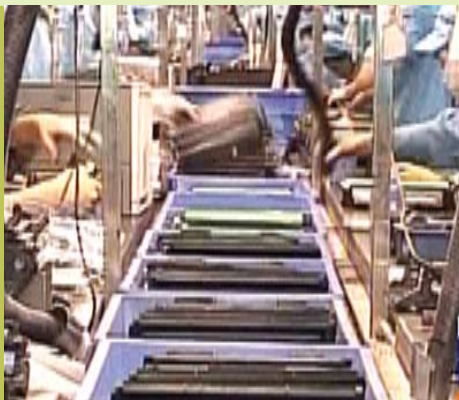
使用循环再造的打印机墨盒，既可保护环境，又可为产品增值