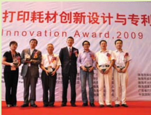
打印耗材行业鼓励创意、创新、原创，以及重视知识产权