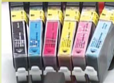
创新产品需要知识产权的保护

有了好的概念、取得专利权后，下一步便是作出具体的计划，了解新意念能否在可承担的成本下转化为工业设计，然后开发产品，推出市场。若得到市场的接受，这个新意念才可称得上是成功。