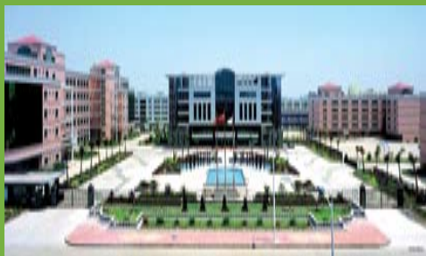
▲ 天威在珠海建立通用耗材生产基地，引入创意生产模式

PRINT-RITE系列产品一直以环保为原则，在生产上著重减低对环境的影响。除此外，打印成本亦较原厂碳粉盒为低，同时亦具有很大的兼容性，适用于多款不同牌子的镭射打印机。PRINT-RITE - PRO-ECO产品以「专业」加入「环保」概念设计，碳粉盒及喷墨盒内置感光鼓或打印头，产品经过回收循环再造及严格测试后才推出市面。